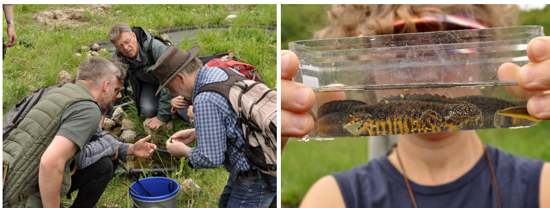
Abb. 8: Gefangene Tiere werden ausführlich begutachtet. / Abb. 9: Zwei Kammmolche, ein Männchen und ein Weibchen konnten gefangen werden und werden hier in einem Klarsichtschälchen präsentiert – das Männchen ist in der Balzzeit im Frühjahr prächtige Wasserdrache.