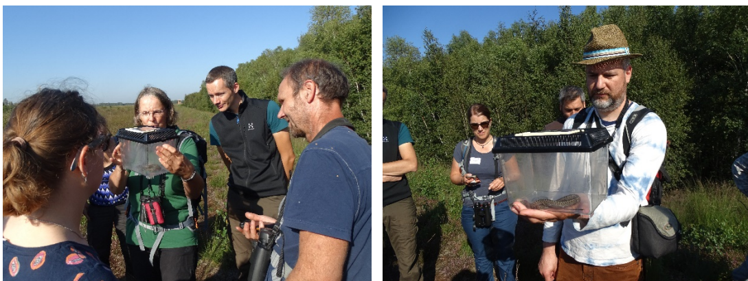
Abb. 17/18: Im Wesuweer Moor im Emsland bei herrlichem Wetter. Zur Anschauung gefangene Tiere, hier eine von mehreren Kreuzottern, werden ausführlich begutachtet, bevor sie zurück in die Freiheit gelassen werden.