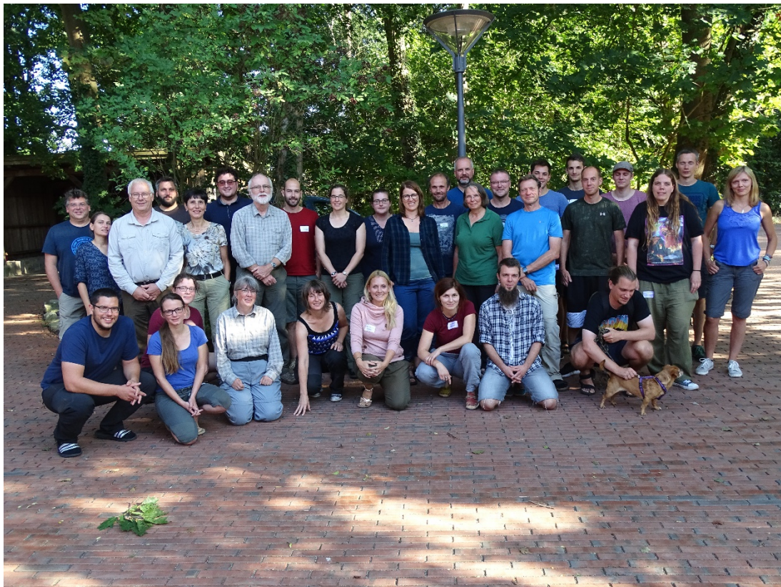
Abb. 18: Der Reptilienkurs an der Station am Heiligen Meer in Recke.