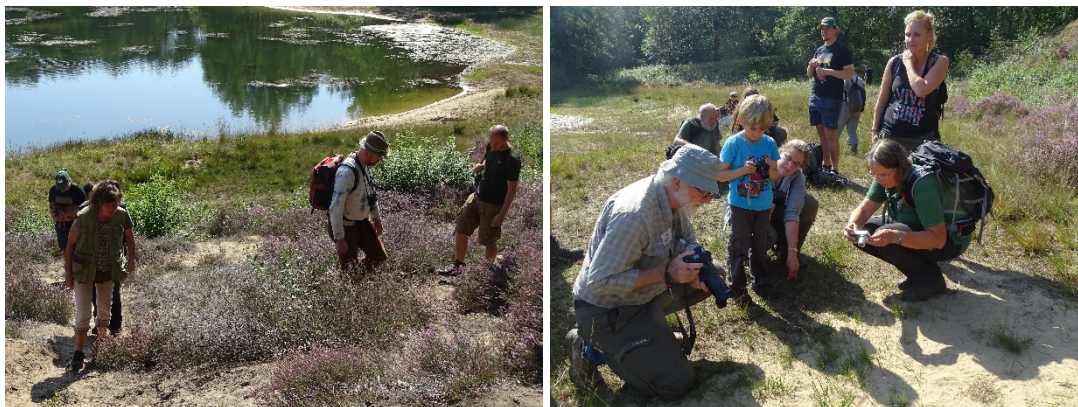
Abb. 19/20: Am Wachendorfer See bei Lingen lebt eine große Zauneidechsen-Population. Auf besonnten Sandböden wurden hier erfolgreich Zauneidechsen gesucht, einzelne auch gefangen und natürlich ausgiebig fotografiert.