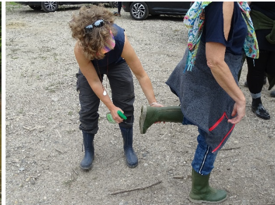
Abb. 12: Über Nacht ausgelegte Beutelboxreusen wurden eingeholt. Foto: Andreas Koch / Abb. 13: Nicht vergessen: Beim Ortswechsel sind Schuhe und Gerät zu desinfizieren.