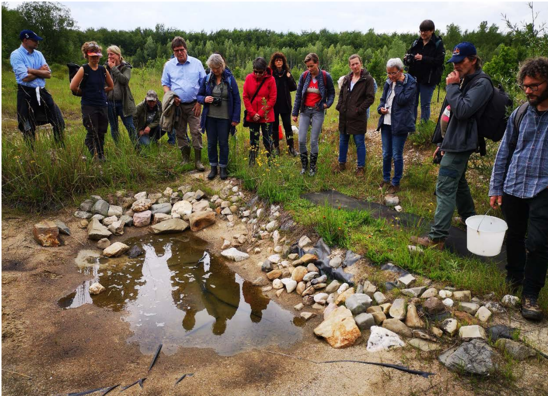
Abb. 10: Teilnehmer des Kurses besichtigen die für Gelbbauchunken, Geburtshelferkröten und Kreuzkröten geschaffenen Gewässer im Rahmen des Life-Projektes.