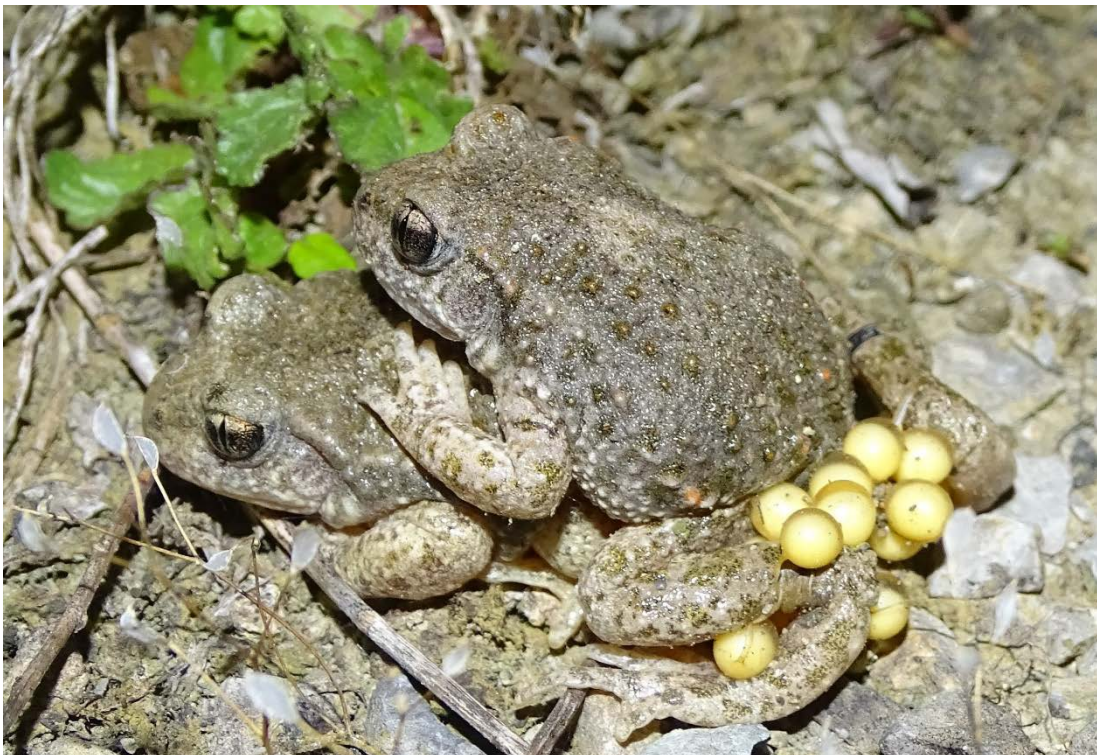
Abb. 11: Zwei Geburtshelferkröten in einem Steinbruch bei Stolberg, offenbar hatte das Männchen kurz zuvor die Eier übernommen.